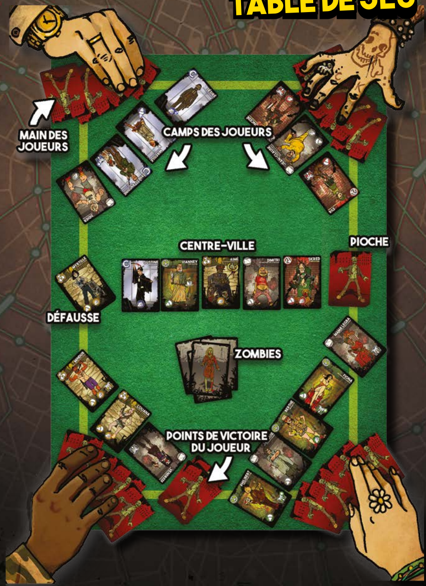
TABLE DE JEU

Lors du premier tour de jeu, les joueurs arrivent progressivement en ville. Tant qu'un joueur n'a pas commencé à jouer son tour, il est considéré « hors-jeu » (il ne peut ni subir de pertes, ni être attaqué, ni jouer de cartes Événements ou en subir). Si les Zombies le désignent comme cible, ceux-ci ne les trouveront pas et l'attaque Zombie sera annulée.