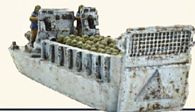
US Landing Craft