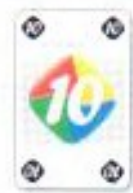
Joker de 2 à 12 (cf. variante)

Chaque joueur tente de cocher des nombres dans les quatre couleurs, sur sa feuille de score. Plus on a de croix dans une piste de couleur, plus on va marquer de points. Attention : on ne coche pas exactement de la même manière que dans Qwixx ! Voir plus loin.