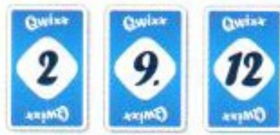
Verso correspondant (même nombre / couleur neutre)