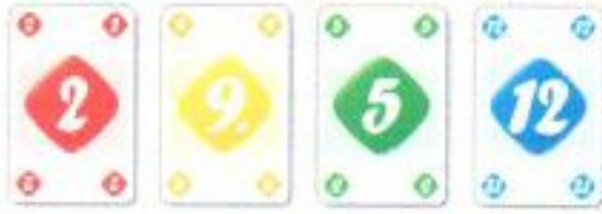
44 cartes, de 2 à 12 dans chaque couleur (rouge, jaune, vert, bleu)

Qwixx, le jeu de cartes, un jeu de Steffen Benndorf et Reinhard Staupe pour 2 à 5 joueurs de plus de 8 ans