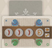
20 cartes Tablée