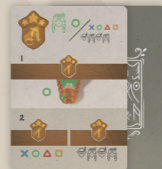
12 cartes Objectif (divisées en paquets A et B)