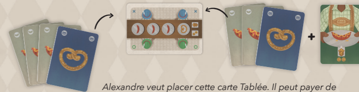
Alexandre veut placer cette carte Tablée. Il peut payer de deux manières différentes : en utilisant les 4 cartes de sa main (gauche) ou en utilisant un Héros à la place de l'une de ses cartes (droite). Dans ce dernier cas, il lui reste donc 1 carte en main après avoir placé la tablée.

Lorsque vous placez une tablée dans le Festival, prenez une carte Points de victoire et placez-la devant vous. Ces points seront ajoutés à votre score final. Ces cartes sont recto verso. Elles indiquent 1 point sur une face et 2 points sur l'autre. Lorsque vous avez déjà une carte de valeur « 1 point » en votre possession, retournez-la sur l'autre face au lieu de prendre une deuxième carte de valeur « 1 point ». Prenez également une carte Pièces de valeur « 2 pièces » et ajoutez-la à votre main. Si vous n'avez utilisé que des Héros pour servir vos clients, vous avez donc toujours 4 cartes en main. Dans ce cas, vous devez défausser l'une de vos cartes afin de recevoir la carte Pièces.