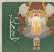
19 cartes Héros (divisées en paquets 1 et 2)