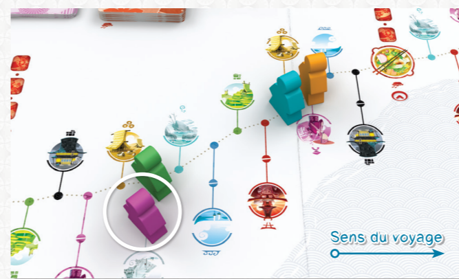
Le Voyageur violet est considéré plus loin que le Voyageur vert (emplacement double). C'est donc à lui de jouer.