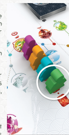
Le Voyageur vert repartira le premier du Relais

Le premier Voyageur occupe obligatoirement l'emplacement le plus près de la route. Les autres Voyageurs forment une file derrière lui.