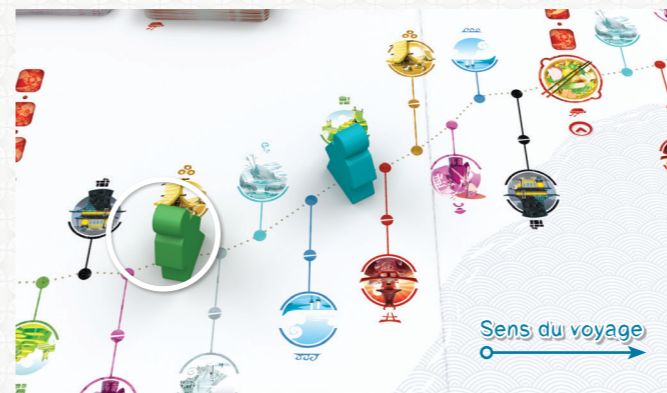
Le Voyageur vert est le plus loin sur la route, c'est donc à lui de jouer.

C'est le cas, jusqu'à ce que son pion Voyageur se retrouve devant celui d'un autre joueur.