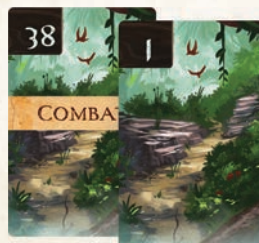
Cartes numérotées (69)