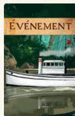
Cartes Événement (12)