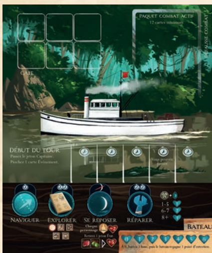
Plateau Action (1)