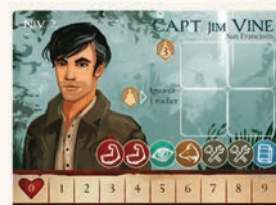
Plateaux Équipage (5)