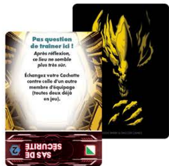
24 cartes Équipage