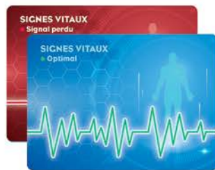
10 cartes Signes vitaux