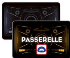
8 cartes Cible