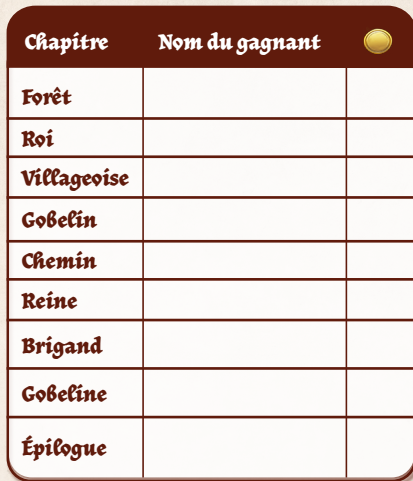
Tableau de score

Le grand vainqueur est le joueur ayant cumulé le plus d'or au fil des chapitres.