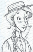
Cartes Fil Rouge